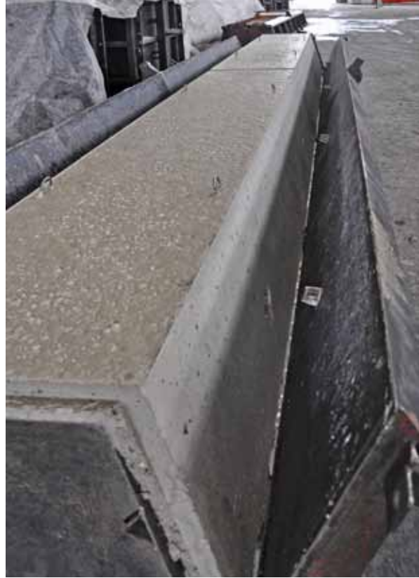
Figure: Bianchi, Canonico, Arena, Zoppi

Die Labor-Probekörper aus SVB (15 x 15 x 15 cm) wurden unter Einsatz eines Planeten-Zwangsmischers mit vertikaler Achse betoniert (Zyklus, Modell ZK75 HE). Es wurden Versuche zur Ermittlung des Ausbreitmaßes durchgeführt, um den Verarbeitbarkeitsverlust des SVB zu messen. Für jedes Gemenge wurden nach 24 Stunden sowie nach 7 und 28 Tagen die Druckfestigkeiten