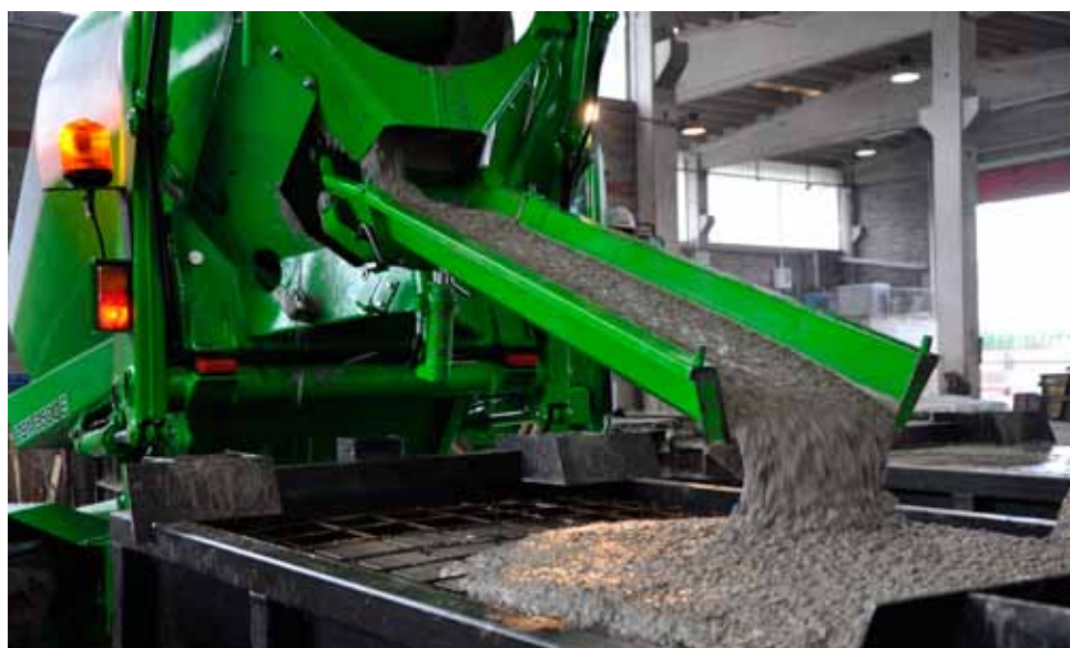
Figure: Bianchi, Canonico, Arena, Zoppi