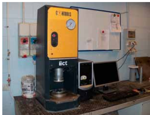
Figure: Bianchi, Canonico, Arena, Zoppi

CSA-Zement hat in den vergangenen Jahren als umweltfreundliche Alternative zu gewöhnlichem Portlandzement (OPC) zunehmende Verbreitung gefunden. Dieser Zement ist durch hohe mechanische Leistungswerte mit hoher Frühfestigkeit und geringem Schwinden gekennzeichnet. Zudem wird CSA-Zement im Vergleich zu OPC