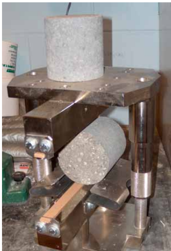
Figure: Bianchi, Canonico, Arena, Zoppi

Tab. 3 enthält eine Übersicht der Mischungsentwürfe der im Labor und während der industriellen Versuche im Fertigteilwerk untersuchten Betone. Für den Entwurf der steifen Betongemenge wurden natürliche Gesteinskörnungen eingesetzt, die aus einem Sand 0/4 (45 %), einem groben Sand 0/5 (40 %) sowie einem Kies 5/8 (15 %) bestanden.