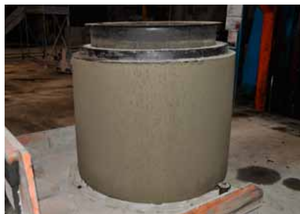
Figure: Bianchi, Canonico, Arena, Zoppi

Tab. 8 enthält eine Darstellung der Festigkeits- und Dauerhaftigkeitsprüfungen, die für den aus dem während des industriellen Versuchs hergestellten SVB-Element entnommenen Bohrkern durchgeführt wurden.