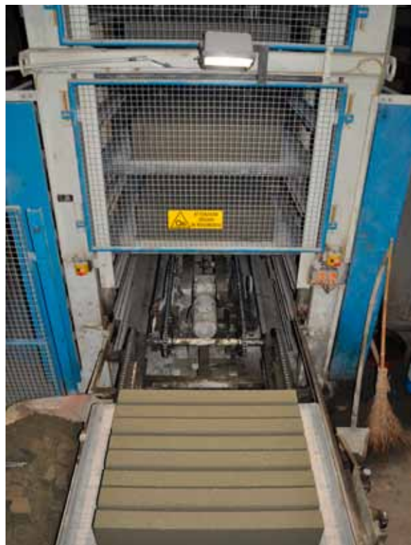
Figure: Bianchi, Canonico, Arena, Zoppi