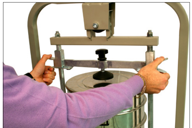
Установка системы зажимных приспособлений.