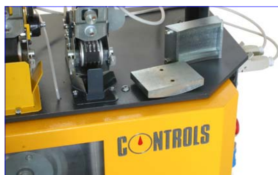
Dettaglio formella e piastra