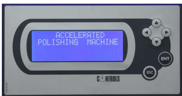
Dettaglio pannello di controllo